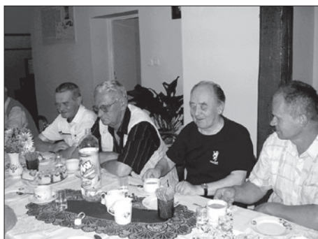
Spotkanie przy kawie