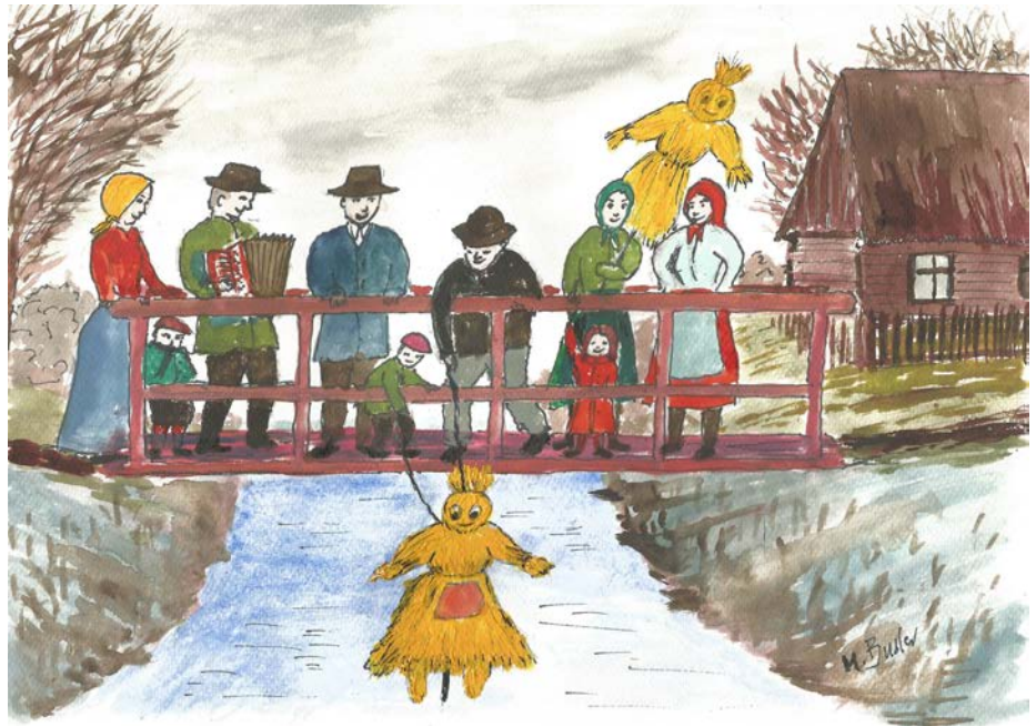
Rys. M. Busler

Główne pożywienie postne stanowiły suszone owoce, z których sporządzano zupy owocowe tzw. brzad, ponadto bardzo popularny żur, krupy jęczmieńne, ziemniaki podawane najczęściej z zsiadłym mlekiem lub maślanką, ryby (głównie śledź, nazywany żartobliwie pòstnikiem), woda solona ze śledzi tzw. śledzówka, która była stosowana do omasty. Unikano spożywania jaj i masła. Ważnym punktem Wielkiego Postu był dzień św. Grzegorza przypadający na 12 marca, podczas którego młodzież topiła w rzekach i jeziorach słomianą kukłę, będącą symbolem zimy. W tym obrzędzie możemy zauważyć podobieństwo do stosowanego do dziś, zwyczaju topienia marzanny w pierwszy dzień wiosny w większości regionów Polski. Dzień św. Grzegorza miał duże znaczenie dla kaszubskich rybaków z Nordy. Wówczas następowała uroczysta inauguracja sezonu łososiowego. Przed pierwszymi połowami o wschodzie słońca, dokonywano na brzegu poświęcenia niewodu. Odbывало się to bez udziału kobiet. Pierwsze zarzucenie sieci