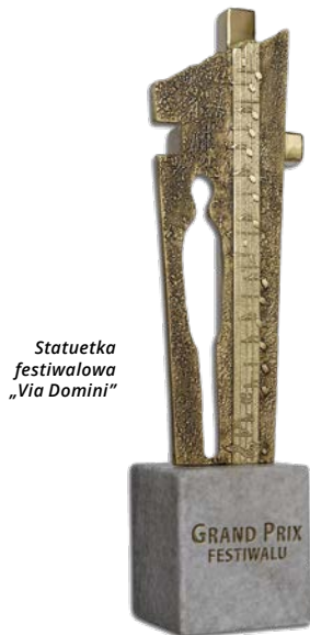
Statuetka festiwalowa „Via Domini”

Adoro te devote (łac. „Kłaniam Ci się na bōżnie”) to jeden z łacińskich średnio-wiecznych hymnów eucharystycznych, który w tym roku będzie utworem przewodnim „XIII Pomorskiego Festiwalu Pieśni Wielkopostnej – Szemud 2019”.