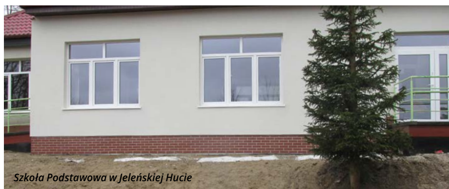
Szkoła Podstawowa w Jeleńskiej Hucie