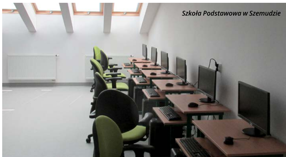
Szkoła Podstawowa w Szemudzie