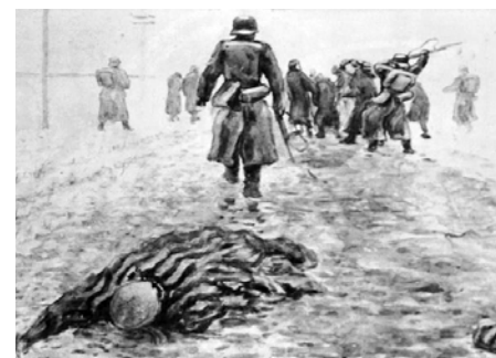
„Marsz Śmierci” - obraz M. Kuzniecowa