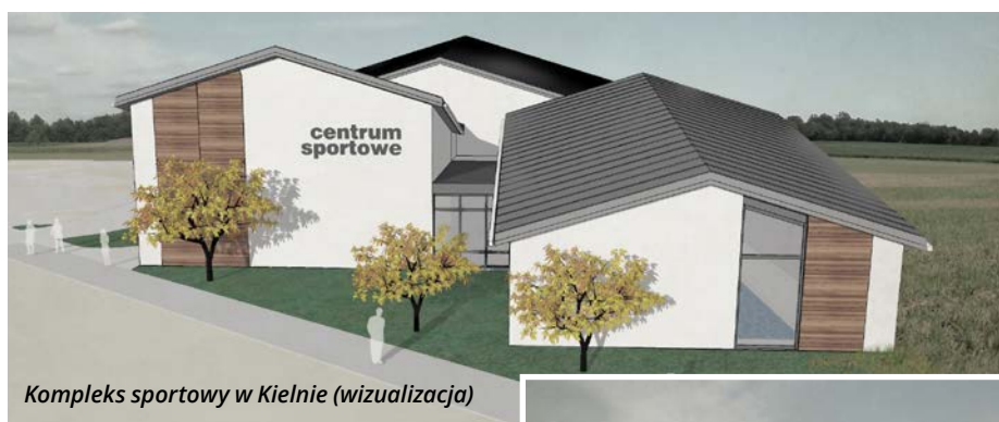
Kompleks sportowy w Kielnie (wizualizacja)