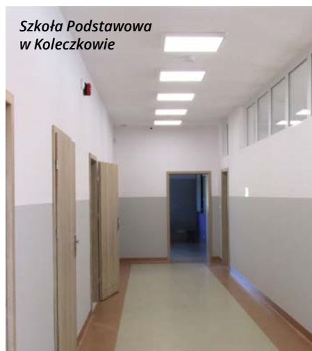
Szkoła Podstawowa w Koleczkowie