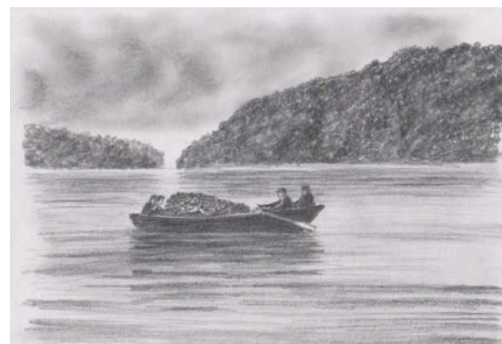
Pogrzebowa przeprawa przez jezioro. Rys. Marian Busler