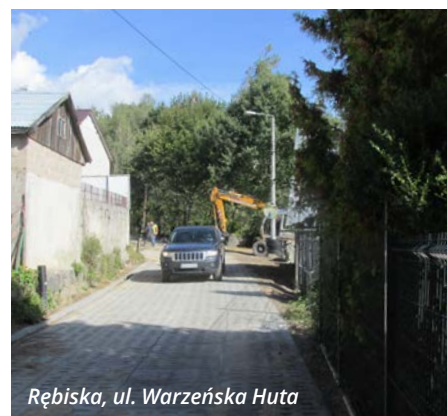
Rębiska, ul. Warzeńska Huta