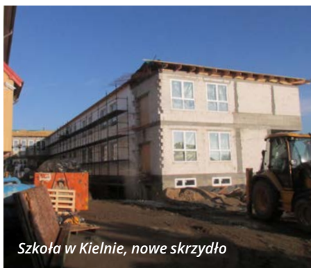
Szkoła w Kielnie, nowe skrzydło

Trwają prace przy rozbudowie szkoły w Kielnie i remoncie budynku starej szkoły.