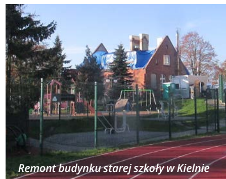
Remont budynku starej szkoły w Kielnie