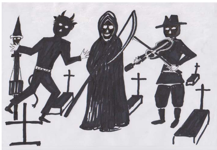
Grupy chłopców odpędzające złe duchy. Rys. Marian Busler

Złe duchy i czarownice zatrzymywały wspo-