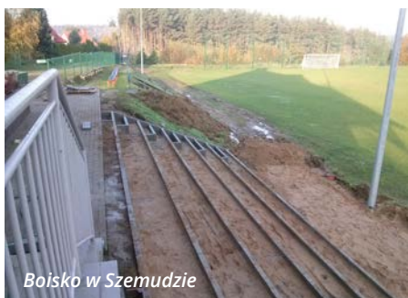
Boisko w Szemudzie