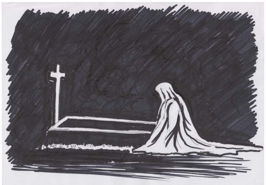
Dusza pokutująca. Rys. Marian Busler

Kaszubi wyobrażali sobie śmierć jako chudą, bladą kobietę, okrytą białą płachtą. Stąd jej określenie – biòtò (biała) . Jej zwiastunami były często sny, w których pojawiało się wypadanie włosów, piasek, mięso, wypiekanie chleba, wesele i bielizna. Wierzono, że szybka śmierć może spotkać człowieka zbyt często oglądającego swoje ręce lub zdejmującego często pierścionek z palca. Nadejście śmierci zwiastowały różne inne znaki w postaci dziwnych odgłosów i hałasów w domu, zatrzymanie zegara – jak chtos ùmrze, zégar sóm staje (jak ktoś umrze, zegar sam staje) , chwytanie za klamkę i uderzanie w okno. Takie zwiastu-