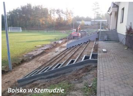
Boisko w Szemudzie

Ruszyły prace przy modernizacji boiska wiejskiego w Szemudzie wraz z budową trybun. Przewidywane jest wykonanie 350 miejsc dla kibiców. Planowane zakończenie robót winno nastąpić do końca listopada br.