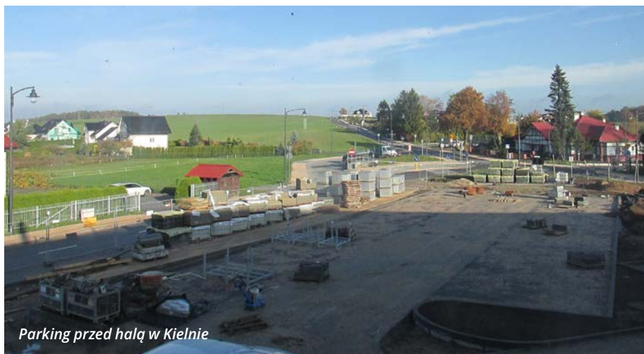
Parking przed halą w Kielnie