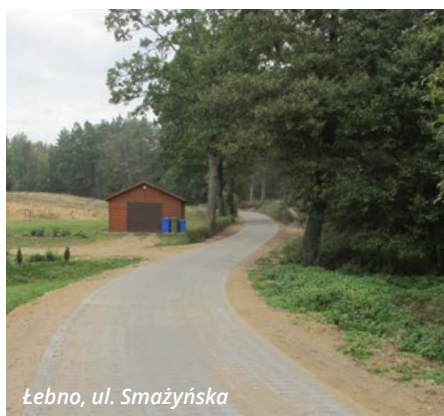
Łebno, ul. Smażyńska