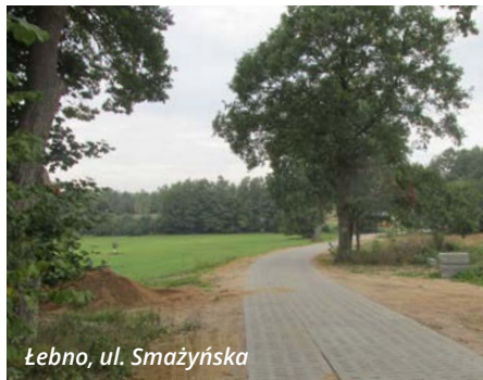
Łebno, ul. Smażyńska

W ostatnim czasie wykonano utwardzenie płytami yomb ulicy Smażyńskiej w Łebnie oraz ulicy Warzeńska Huta w Rębiskach.