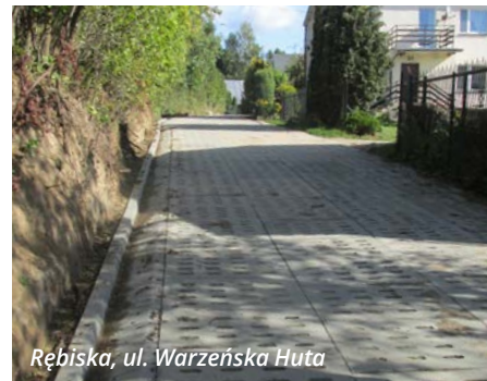
Rębiska, ul. Warzeńska Huta