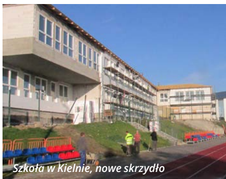
Szkoła w Kielnie, nowe skrzydło