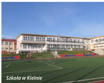
Szkoła w Kielnie