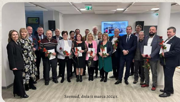
Szemud, dnia 11 marca 2024 r.