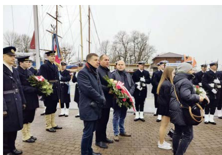
Obchody rocznicy Zaślubin Polski z Morzem