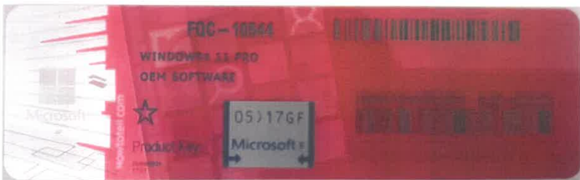
Rys. 1 przykładowy kod zabezpieczony przez producenta systemu Microsoft Windows 11 (takie same naklejki mają Windows 10) z wymazanym, znajdującym się przed i za szarą naklejką kodem licencyjnym