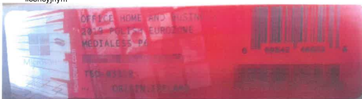
Rys. 2 przykładowy kod zabezpieczony przez producenta systemu Microsoft Windows Office Home&Business z wymazanym, znajdującym się w prawym dolnym rogu numerem seryjnym produktu. Kod licencyjny znajduje się w środku szczelnie zapakowanego i zafoliowanego pudełka (Rys. 3)